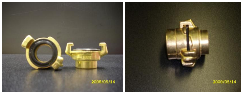
Bild 4 – Bajonett Schnellverbinder, diese Verbinder können zum einfachen Anschluss vom Druckgefäß zum Systemauffüllen ausgenutzt werden. Auch andere Verbinder für Wasser können verwendet werden.