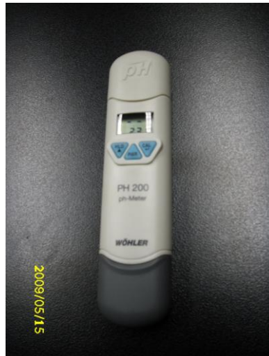
Bild 3 – der Bestimmung vom pH-Wert der untersuchten Lösung dienendes elektronisches pH-Messgerät