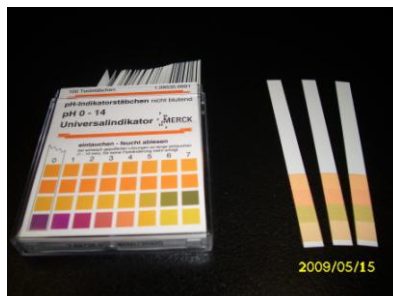
Bild 2 – der Bestimmung vom pH-Wert der untersuchten Lösung dienende pH-Indikatorpapiere. Auf dem Schachtel ist die pH-Farbskala, nach der der pH-Wert bestimmt wird.

Beim Spritzgerät wird der Schlauch mit dem Originalendstück abgeschnitten und mit dem Schlauchanschlussstück mit Bajonett Schnellverbinder ersetzt. Jetzt ist das Spritzgerät zum einfachen Anschluss angepasst. Es ist möglich, auch andere End- und Reduktionsstücke für Wasser auszunutzen. Am Einlasshahn wird der Bajonett Schnellverbinder mit Innengewinde eingebaut.