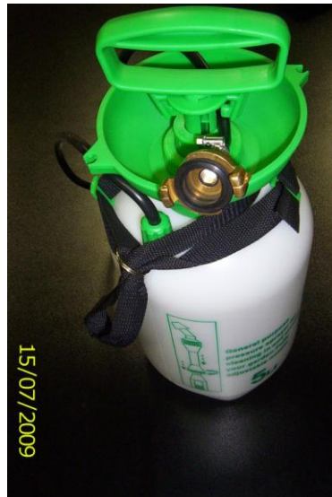
Bild 1A – Angepasstes Gartenspritzgerät, es dient als Druckfüllgefäß (bis 3 bar, nach der Art des Spritzgeräts)

Beim Spritzgerät wird der Schlauch mit dem Originalendstück abgeschnitten und mit dem Schlauchanschlussstück mit Bajonett Schnellverbinder ersetzt. Jetzt ist das Spritzgerät zum einfachen Anschluss angepasst. Es ist möglich, auch andere End- und Reduktionsstücke für Wasser auszunutzen. Am Einlasshahn wird der Bajonett Schnellverbinder mit Innengewinde eingebaut.